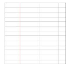
A righe 1° - 2° elementare * margine sinistro e destro